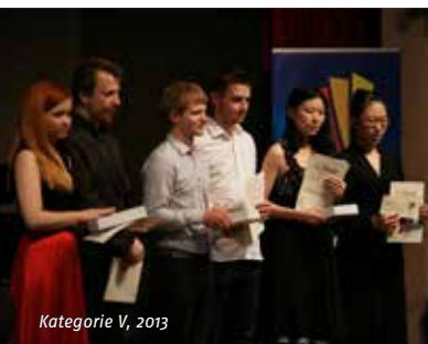
Kategorie V, 2013