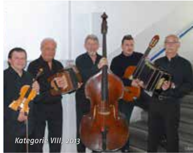
Kategorie VIII, 2013