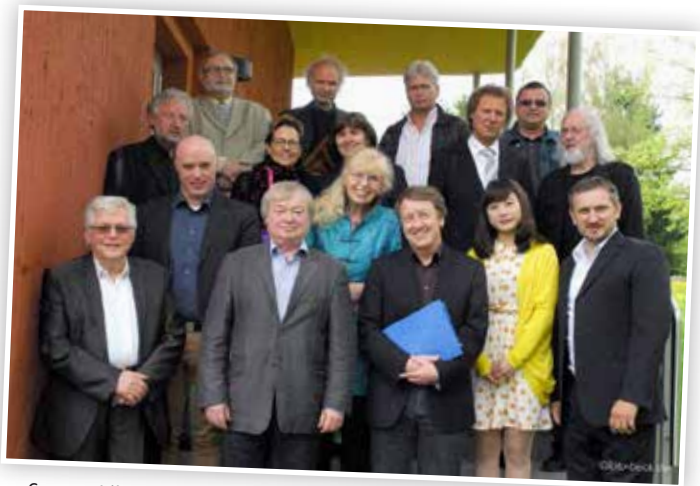
Gruppenbild der Jury im Jahr 2013