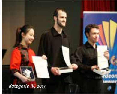
Kategorie IV, 2013