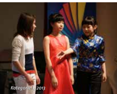
Kategorie I, 2013