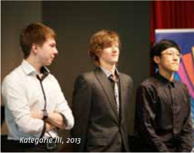
Kategorie III, 2013