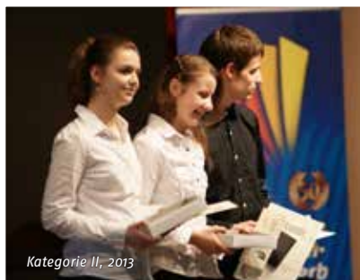
Kategorie II, 2013