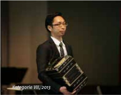
Kategorie VII, 2013