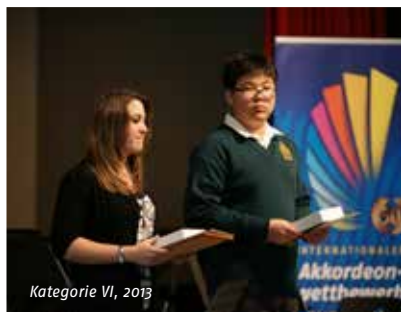
Kategorie VI, 2013