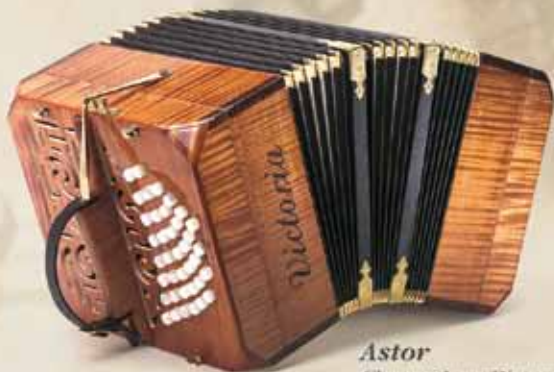
Astor Chromatic or Diatonic

Models manufactured with finest acoustic woods by a real lute-maker.